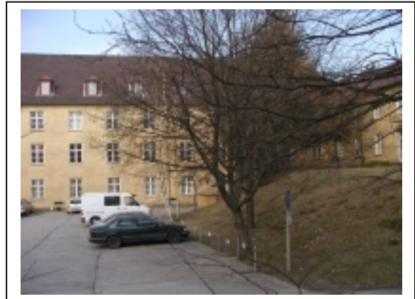
Mittelflügel (rechter Teil)