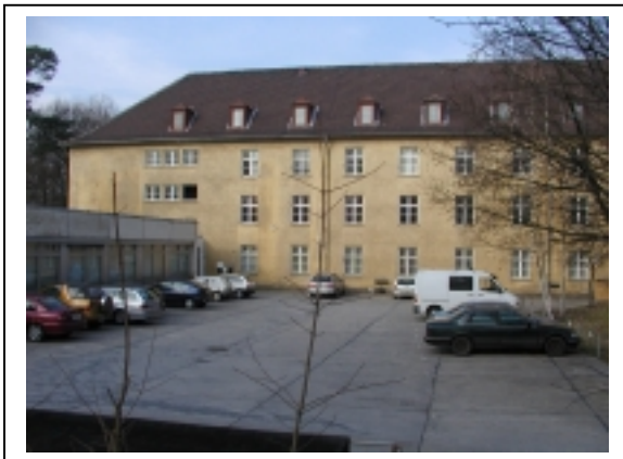
Mittelflügel (linker Teil)