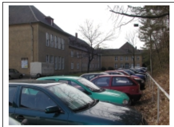
Kopfbau mit anschliessenden Nordflügel