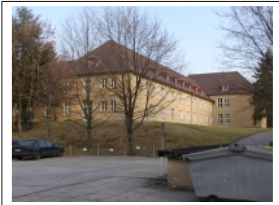
Nordflügel (Richtung Kopfbau)